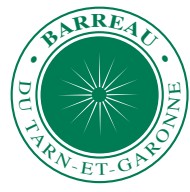
TABLEAU DE L'ORDRE DES AVOCATS AU BARREAU DE TARN-&GARONNE